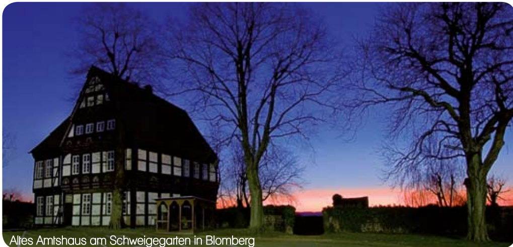
Altes Amtshaus am Schweigegarten in Blomberg