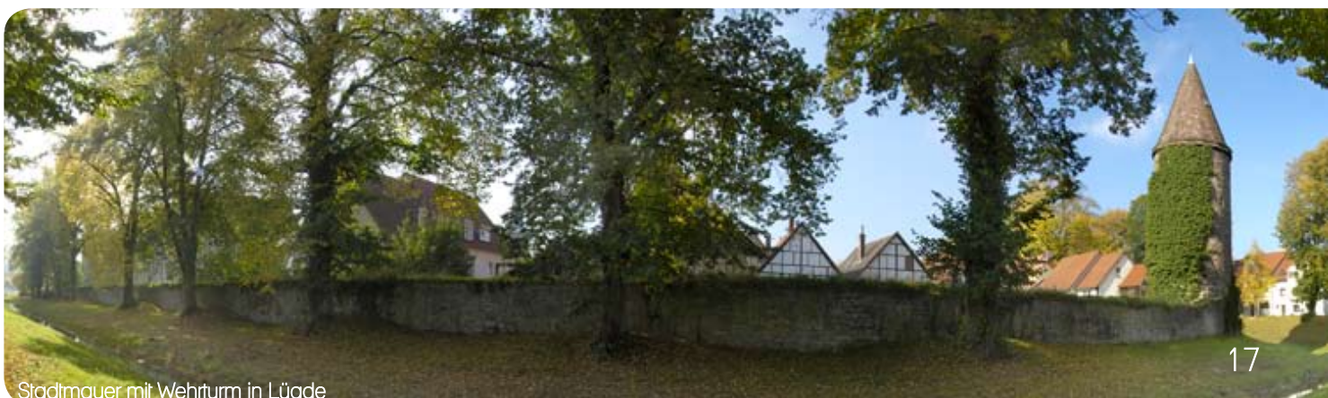
Stadtmauer mit Wehrturm in Lügde